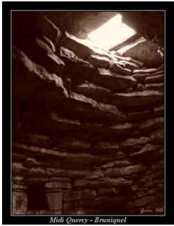
Midi Quercy - Bruniquel

Mercredi, 09 Janvier 2008 07:44 - Mis à jour Dimanche, 29 Mars 2009 14:04