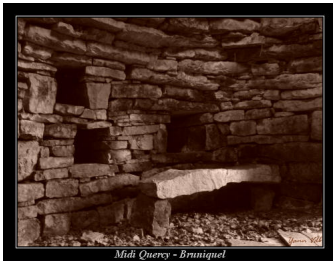
Midi Quercy - Bruniquel